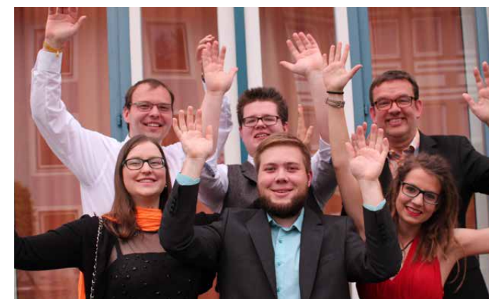
Unsere neue Diözesanleitung mit Diözesanem Arbeitskreis

Am Samstag durften die Teilnehmer/innen zum Thema „Upcycling“ aus vermeintlichem Müll Blumenvasen, Geldbörsen und andere nützliche Gegenstände herstellen, zum Thema „Nachhaltig einkaufen“ gemeinsam im Supermarkt die Snacks für den folgenden Konferenzteil einkaufen, im Workshop „Woher kommt meine Jeans?“ lernen, was man bei Klamotten beachten muss, um sich nachhaltig zu kleiden sowie unter dem Schlagwort „Divestment“ erfahren, wie man sich dafür einsetzen kann, dass Firmen und Organisationen ihr Kapital nicht mehr in umwelt- und klimaschädliche Anlagen investieren.