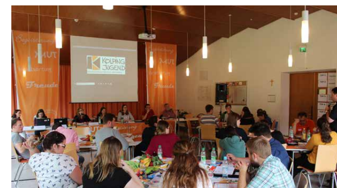
Die Vertreter/innen der Kolpingjugend bei der Arbeit

Am Ende kann man sagen, dass es ein sehr abwechslungsreiches und spannendes Wochenende war und wer nicht dabei war, hat wirklich etwas verpasst!